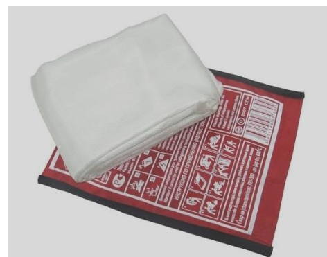
Рис. 3 - кошма

Противопожарное полотно (кошма) предназначена для изоляции очага горения от доступа воздуха. Этот метод очень эффективен, но применяется лишь при небольшом очаге горения. Нельзя использовать для тушения синтетические ткани, которые легко плавятся и разлагаются под воздействием огня, выделяя токсичные газы. Продукты разложения синтетики, как правило, сами являются горючими и способны к внезапной вспышке.