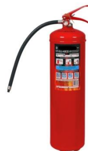
Рис. 5 – порошковый огнетушитель

Важно помнить, что огнетушитель может помочь только в случае своевременного использования на ранней стадии пожара. Именно поэтому следует выбрать оптимальное и легкодоступное место для размещения и хранения огнетушителя. Также, рекомендуется, после использования огнетушителя, когда открытый очаг пожар уже не наблюдается, пролить место возникновения пожара водой и разобрать сгоревшие вещи.