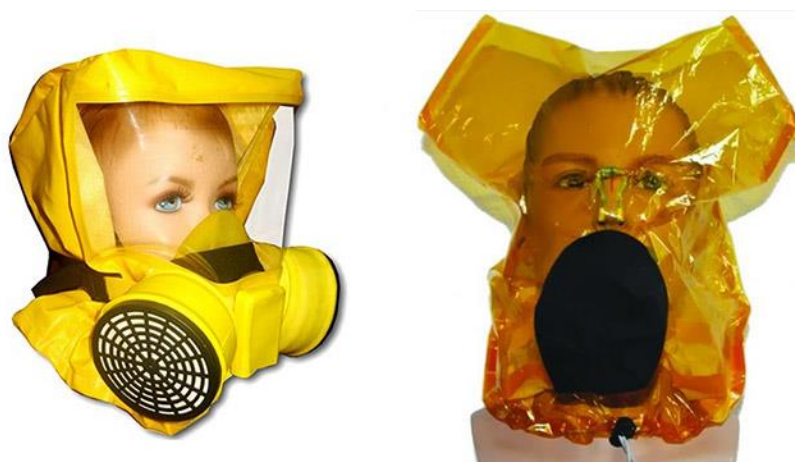
Рис. 7 – фильтрующие средства защиты органов дыхания

В зависимости от действия и назначения средства для защиты органов дыхания разделяют на две группы: изолирующего и фильтрующего типа. Для индивидуального использования гражданами подходят фильтрующие самоспасатели, так как они полностью готовы к действию и не имеют дополнительных элементов. Время защитного действия такого типа самоспасателя не менее 20 минут, чего достаточно для эвакуации человека в безопасную зону. Важно помнить, что фильтрующие средства защиты предназначены для однократного использования, их повторное применение не допускается. Наиболее распространенными марками среди фильтрующих средств защиты органов дыхания являются «Феникс» и «Шанс». После приобретения средств защиты органов дыхания для индивидуального использования, необходимо подробно ознакомиться с инструкцией по их применению.