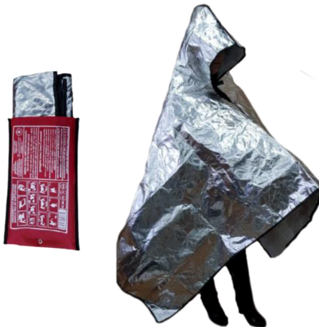
Рис. 8 – специальные огнестойкие накидки

обеспечения безопасной эвакуации при пожаре. Кроме основного назначения, огнестойкие накидки могут быть использованы как первичные средства пожаротушения (кошма) для изоляции очага возгорания. Накидка проста в эксплуатации и используется без специальной подготовки человека.