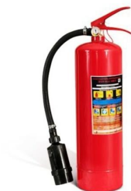
Рис. 6 – воздушно-пенный огнетушитель