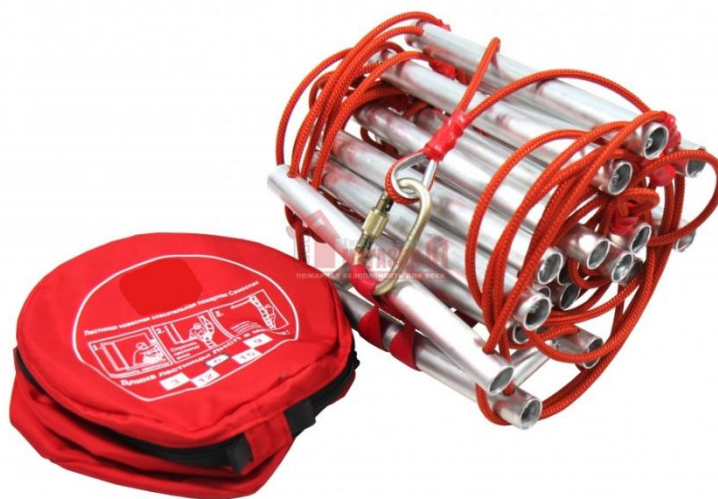
Рис. 10 – навесная спасательная лестница

Навесные спасательные лестницы предназначены для самостоятельной эвакуации людей из помещений при пожарах до прибытия пожарно-спасательных подразделений. Данный тип лестниц хранится в компактном контейнере в легкодоступном месте жилого помещения, при необходимости использования лестница фиксируется за специальные анкеры, установленные в непосредственной близости к месту предполагаемой эвакуации и вывешивается снаружи здания. Спуск по лестнице спасаемые производят самостоятельно. Основным достоинством данного типа спасательного оборудования является простота его использования. Высота спуска не более 15 метров.