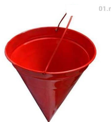
Рис. 1 – пожарное ведро

Вода - самое распространенное средство для тушения огня. Огнетушащий эффект воды заключается в охлаждении горящих материалов и очага пожара. Вода электропроводна, поэтому ее нельзя использовать для тушения сетей и установок, находящихся под напряжением. При попадании воды на электрические провода может возникнуть короткое замыкание и удар электрическим током. Также вода неэффективна при тушении горящего масла, так как она легче большинства легковоспламеняющихся и горючих жидкостей. Тушение масел и других горючих жидкостей водой приводит к увеличению площади горения.