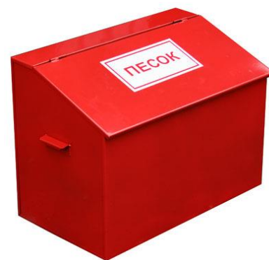
Рис. 2 – ящик с песком

Песок и земля с успехом применяются для тушения небольших очагов горения, в том числе разливов горючих жидкостей (керосина, бензина, масла, смолы и др.) Насыпать песок следует по внешней кромке горящей зоны, стараясь окружать песком место горения, препятствуя дальнейшему растеканию жидкости. Затем при помощи лопаты нужно покрыть горящую поверхность слоем песка, который впитает жидкость.