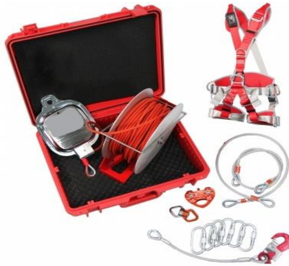
Рис. 9 – канатно-спусковое устройство