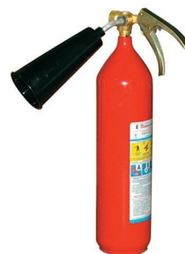
Рис. 4 – углекислотный огнетушитель

Углекислотный огнетушитель является наиболее оптимальным вариантом для жилых помещений, в первую очередь это связано с большим количеством пожарной нагрузки в помещениях, также углекислотный огнетушитель является наиболее эффективным для тушения возгорания бытовой техники или проводки. Одно из явных преимуществ углекислотных огнетушителей – его безопасность для здоровья человека.