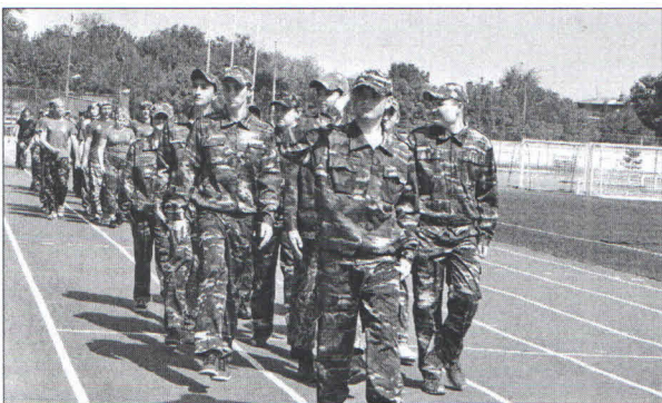
■ В соревнованиях приняли участие десять команд со всего района