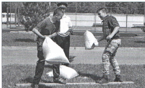
■ Один из интересных видов состязаний - борьба подушками на бревне