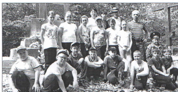
■ Казаки и школьники уже не первый раз ходят на Ламбину в преддверии Дня Победы

В ожесточённых боях за освобождение Северского района от немецко-фашистских захватчиков у горы Ламбина погибло порядка пяти тысяч наших бойцов. В честь этого на горе была установлена памятная стела, а в 2015 году за счёт собственных средств районные казаки поставили поклонный крест. Казаки под дождём на руках несли его до исторического места и, пройдя 14 километров, воздвигли на самую вершину горы в память о погибших защитниках Отечества.