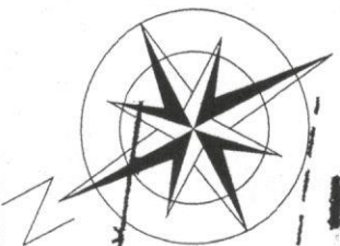
Схема планировочной организации